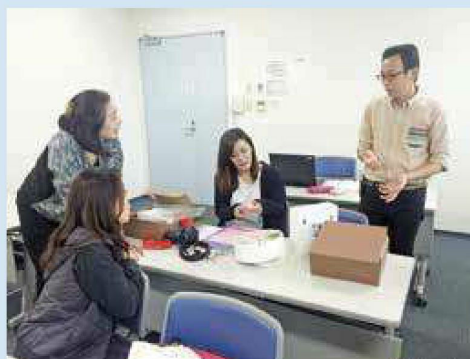
ネット販売用の商品開発など、 セミナーやワークショップを随時開催