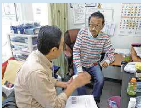
おもてなしギフト出店に向けて、店舗や事業所に訪問してヒアリングを実施。 訪問できない場合には、ネット会議も行います。