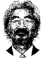
落丸 正博 落丸都市設計(有)