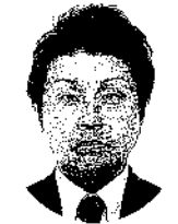
丸金 寛佳 すみれ薬局(有)