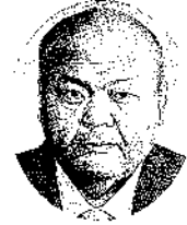
田中 健一 株)田中写真印刷